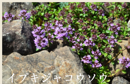
イブキジャコウソウ