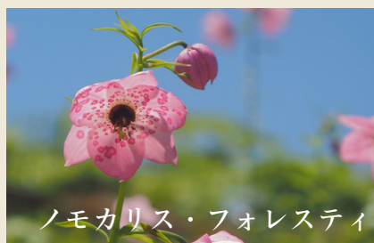
ノモカリス・フォレストイ