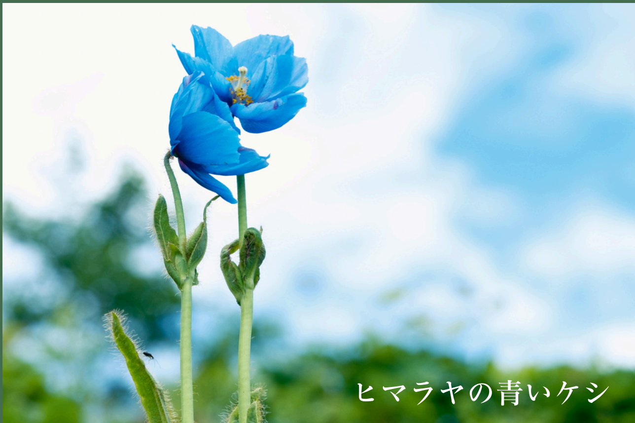
ヒマラヤの青いケシ