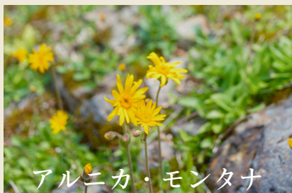
アルニカ・モンタナ